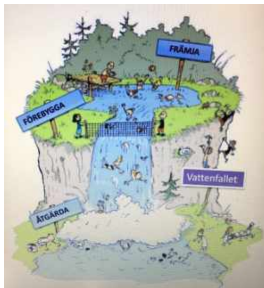
Illustration av begreppen främja, förebygga och åtgärda. Att främja innebär att lära alla att simma, genom att sätta upp ett staket förebygger man drunkning och när någon ramlar i vattnet åtgärdar man genom att livrädda.

Åtgärdande arbete sker när något hänt som måste stoppas och hanteras så det inte händer igen. Det handlar om att ha rutiner för skydd, att utreda förhållandena, att rapportera kränkningar av olika slag, att informera barn, elever och vårdnadshavare samt att ha rutiner för tillämpning av disciplinära åtgärder och för samverkan med andra myndigheter.